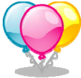
Fiesta de despedida