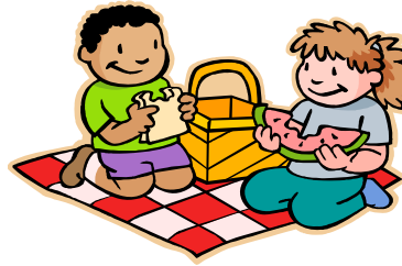
Viajes y excursiones